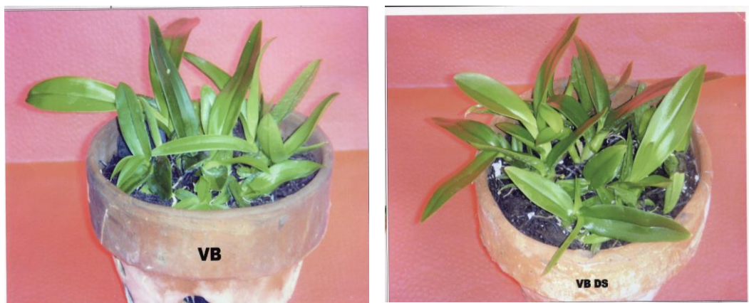
Gambar 2. Pertumbuhan bibit anggrek yang diberi perlakuan pemupukan dengan Vitabloom (VB) dan pupuk vitabloom yang dikombinasikan dengan Dekastar (VB DS)

Jika dilihat dari pertumbuhan bibit secara keseluruhan, pertumbuhan bibit yang diberi pupuk vitabloom saja menghasilkan bibit yang vigornya lebih baik. Hal ini dapat dilihat dari hasil