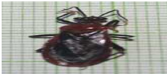
Gambar 5. Imago jantan Rhiginia cruciata

Klasifikasi R. cruciate (Gambar 5) adalah kelas: Insekta, ordo: Hemiptera, subordo: Heteroptera, infraordo: Cimicomorpha, Family: Reduviidae, subfamily: Ectrichodiinae, genus: Rhiginia , spesies: cruciata . Morfologi dari kepik predator ini memiliki dua antena yang berbentuk genikulate yang berwarna hitam, caput berbentuk melebar kesamping, dengan mata majemuk melebar ke bagian caput. Abdomen berbentuk pipih dan melebar bagian belakang yang berwarna merah, sayap depan menebal dibagian pangkal ujungnya transparan atau hemelytra. Memiliki tiga tungkai berwarna cokelat muda yang mana ruas koxa, tibia dan femurnya memiliki rambut halus, dan tarsus berwarna orange. Hanya ditemukan pada perkebunan kelapa sawit di Nagari Gunung Selasih sebanyak 1 individu. Imago jantan tertarik dengan cahaya. Selain itu imago jantan didominasi warna merah yang lebih pekat, begitu juga dengan warna hitam yang terdapat pada sayap juga lebih pekat dibandingkan imago betina. Pada sisi lateral imago betina lebih didominasi warna merah cerah.