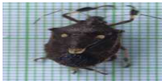
Gambar 2. Eocanthecona furcelata

E. furcelata (Gambar 2) adalah kelas: insekta, ordo: Hemiptera, Family: Pentatomidae, genus: Eocanthecona dan spesies: furcellata . Spesies ini ditemukan di Nagari Panyubarangan sebanyak 2 individu dan di Nagari Gunung Selasih 1 individu. Pada saat pengambilan sampel di lapangan, stadium yang ditemukan pada penelitian ini adalah pada imago. Spesies ini banyak ditemukan pada daun sawit. Imago E. furcelata , memiliki tiga pasang tungkai, tungkai berwarna hitam coklat, dan terdapat warna putih pada ruas femur. Warna tubuh didominasi coklat tua. Pada bagian dorsal terdapat totol berwarna putih yang membentuk pola segitiga. Bentuk tubuh pipih membulat, bagian bawah tubuh berwarna coklat muda dan terdapat garis memanjang bagian anterior dan posterior. Imago jantan dan memiliki morfologi yang hampir sama. Hanya saja terlihat dari ukuran, imago betina lebih besar dibandingkan jantan.