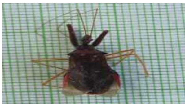
Gambar 9. Imago spesies 1

Spesies 1 adalah salah satu jenis kepik predator yang tidak teridentifikasi, untuk itu maka ditandai dengan kode Sp 1 (Gambar 9). Klasifikasi Sp 1 adalah kelas: insekta, ordo: Hemiptera, subordo: heteroptera, Family: reduviidae. Spesies ini ditemukan di Nagari Panyubarangan 1 individu dan Gunung Selasih ditemukan 1 individu. Spesies ini banyak ditemukan di paku-pakuan yang tedapat dibatang sawit. Tungkai pada spesies ini memiliki tiga pasang tungkai yang mana pada depan tungkai femurnya besar berwarna hitam dan pada dua pasang lainnya famur kecil dan berwarna kuning. Memiliki caput kecil yang melebar ke mata majemuk. Abdomen berbentuk oval pipih, dengan sayap yang saling tumpang tindih sehingga membentuk pola segitiga pada bagian belakang (scutellum). Sayap depan menebal berwarna bening pada pangkal dan ujung transparan, disisi sayap berwarna merah. Alat mulut menusuk menghisap berbentuk paruh yang kaku, digunakan untuk melumpuhkan mangsanya.