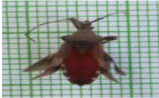
Gambar 6. Euthochhhta galeator