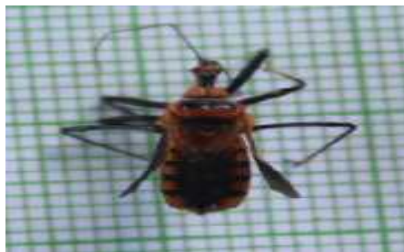
Gambar 7. Apiomerus crassipes

Klasifikasi A. crassipes (Gambar 7) adalah kelas: Insekta, ordo: Hemiptera, subordo: Heteroptera, infraordo: Cimicomorpha, Family: Reduviidae, subfamily: Harpactorinae, genus: Apiomerus , spesies: crassipes . Spesies ini hanya ditemukan di Nagari panyubarangan 1 individu. Stadium yang ditemukan pada fase imago. A. crassipes memiliki caput berwarna hitam, dorsal berwarna orange, anterior mengecil dengan mata majemuk, memiliki sepasang antena yang berbentuk filiform yang panjangnya melebihi panjang tubuh. Tungkai berwarna hitam, bentuk abdomennya lebar memipih. Sayap depan menebal dan ujungnya menipis. Alat mulut seperti beak yang sangat mudah untuk dilihat, mulut menusuk menghisap berbentuk paruh yang panjangnya bisa setengah badan dan berbentuk jarum. Pada sisi lateral imago jantan biasanya berwarna merah sedangkan pada imago betina berwarna kuning. Pada tungkai depan imago betina dan jantan terdapat resin yang bersifat seperti getah untuk memudahkan menangkap mangsa. Imago betina lebih aktif dibandingkan jantan, selain itu imago betina merupakan penerbang yang handal. Kondisi ini yang membuat kesulitan pada saat mengoleksi di lapangan. Di lapangan spesies ini banyak ditemukan pada bunga kelapa sawit yang sedang mekar. Hal ini tidak terlepas dari kepik tersebut merupakan predator dari serangga penyerbuk kelapa sawit Elaeidobius kamerunicus Faust (Coleoptera : Curculionidae).