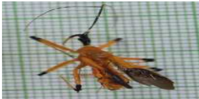
Gambar 4. Imago C. picticeps