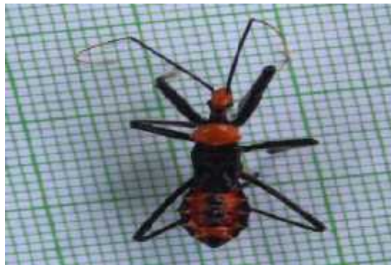
Gambar 8. Arilus cristatus

akan mematikan mangsa dengan menusuk dan menghisap mangsa. Alat mulut berbentuk beak yang mudah terlihat dan terletak didepan kepala. Memiliki tiga pasang tungkai yang berwarna hitam, Spesies ini memiliki tipe raptorial yang berfungsi untuk menangkap dan mencengkram mangsa. Ruas-ruas koksa dan trokhanter berwarna hitam yang diruas tersebut memiliki bulu-bulu dan femur berwarna hitam. Pada penelitian ini hanya ditemukan stadium nimfa sehingga belum bisa dibedakan morfologi jantan dan betina. Dibandingkan enam spesies kepik predator lain, spesies ini merupakan kepik dengan ukuran yang paling besar, walaupun yang ditemukan hanya stadium nimfa.