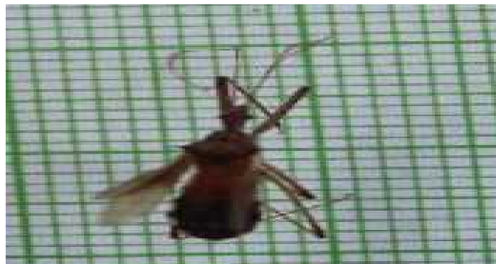
Gambar 3. Imago Zelus renardii

Klasifikasi Z. renardii (Gambar 3) adalah kelas : Insekta, ordo: Hemiptera, subordo : Heteroptera, infraordo : Cimicomorpha, Family: Reduviidae, subfamily: Harpactorinae, genus: Zelus dan spesies: renardii . Spesies ini ditemukan di Nagari Panyubarangan sebanyak 39 individu dan nagari Gunung Selasih sebanyak 25 individu. Spesies ini banyak pada vegetasi bawah kebun kelapa sawit, seperti gulma kentang-kentangan, herendong/senggani, sintrong, dan senduduk. Kepik ini didominasi warna merah kecokelatan, tungkai pada metatorak yang lebih panjang dari pada protorak dan mesotorak. Tubuh berbentuk ramping memanjang, panjang sisi lateral toraks terdapat sepasang duri. Abdomen didominasi warna cokelat, pada ruas pertama abdomen yang menyatu dengan toraks terlihat mengecil, antena terlihat panjang dengan tipe monoliform. Pada penelitian ini ditemukan stadium imago dan nimfa. Untuk imago jantan dan betina memiliki morfologi yang sama. Hanya saja imago betina memiliki warna yang lebih cerah dibandingkan jantan. Pada stadium nimfa belum memiliki sayap hanya saja bakal sayap sudah muncul pada bagian metatorak.