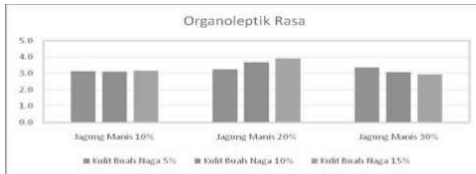
Gambar 1. Rerata kesukaan panelis terhadap rasa mie kering jagung manis dan kulit buah naga

bisa tetap menikmati mie dengan rasa yang khas dan produsen bisa menghemat penggunaan tepung terigu dengan adanya penambahan tersebut.