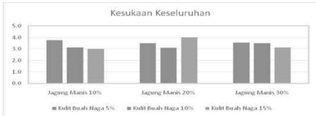
Gambar 4. Rerata kesukaan panelis terhadap kesukaan keseluruhan mie kering jagung manis dan kulit buah naga

sensoris mie kering terhadap atribut kesukaan keseluruhan, secara umum panelis memberikan penilaian netral hingga suka (3,00—4,00) (Gambar 4).