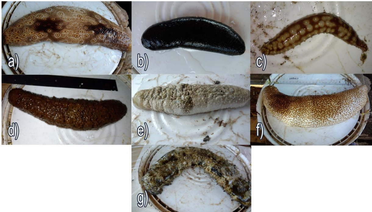
Gambar 1. Spesies teripang yang ditemukan; a). Bohadschia argus ; b). Holothuria atra ; c). Holothuria hilla ; d). Holothuria marmoreta ; e). Holothuria scabra ; f). Holothuria vacabunda ; g). Stichopus horrens

Individu teripang banyak ditemukan berasal dari genus Holothuria . Spesies yang paling banyak ditemukan adalah H. hilla dengan total 72, diikuti H. vacabunda dengan total 66, dan H. atra dengan total 65. Total individu yang didapatkan yaitu 235, dapat dilihat pada tabel (1) sebagai berikut: