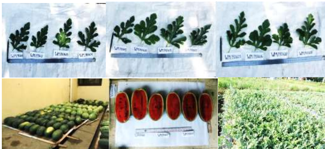
Gambar 3. Morfologi tanaman pada 12 varietas semangka hibrida

Dari data pengamatan morfologi buah, terdapat dua varietas memiliki warna daging buah kuning ( Wong barry dan Yellow sweet ) dan varietas lainnya memiliki daging buah merah (Tabel 5).