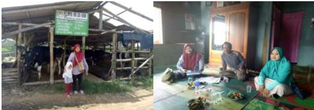
Gambar 1. Kunjungan koordinasi oleh salah satu tim pelaksana kegiatan dengan PPL Desa Sekincau dan Ketua Kelompok Tani Sido Rukun

Kegiatan ini telah berjalan dengan baik. Kegiatan berjalan sebanyak 2 (dua) tahap, yaitu satu kali koordinasi dan 1 kali demonstrasi, pelatihan, dan evaluasi. Koordinasi dilakukan untuk mencari informasi tentang permasalahan susu segar yang dihasilkan oleh kelompok tani Sido Rukun Desa Sekincau kabupaten Lampung Barat (Gambar 1,2).