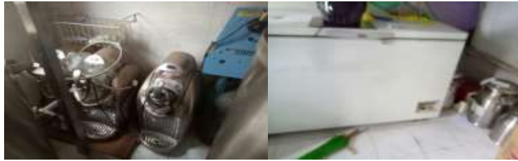
Gambar 1: Alat pengolahan ice cream dan freezer yang belum dimanfaatkan

jumlah sapi betina dewasa 20 ekor dan sisanya adalah pejantan. Sapi dewasa betina memproduksi susu segar rata-rata 8 – 15 liter per ekor dengan harga susu sapi segar berkisar Rp 6.000,00 – Rp 8.000,00 per liter. Namun, penjualan susu segar kurang lancar, hal ini disebabkan kesukaan masyarakat terhadap susu segar masih rendah. Namun, potensi kelompok ternak Sido rukun telah memiliki asset alat freezer 1 (satu) unit, 3 (tiga) alat pengolahan ice cream yang dapat mendukung diversifikasi olahan susu segar dengan kombinasi ekstrak tomat menjadi frozen yogurt (Gambar 1).