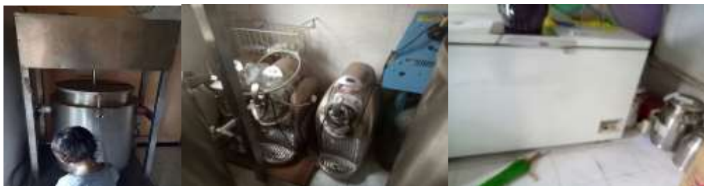
Gambar 2. Asset peralatan pengolahan Ice Cream Kelompok Tani Sido Rukun yang tidak digunakan

Berdasarkan hasil kunjungan yang telah dilakukan oleh tim pelaksana kegiatan diperoleh data bahwa kelompok tani Sido Rukun memiliki asset peralatan pengolahan ice cream yang sudah lama tidak digunakan karena tidak mengetahui proses pengolahan pembuatan ice cream. Oleh sebab itu, tim pelaksana kegiatan hilirisasi memberikan demonstrasi pengolahan yogurt beku (frozen yogurt) dengan kombinasi penambahan tomat. Yoghurt adalah produk susu fermentasi yang diperoleh dari susu atau produk susu dengan fermentasi asam laktat dengan bakteri Streptococcus thermophilus dan Lactobacillus bulgaricus (Aswal, Priyanka., et.al., 2012).