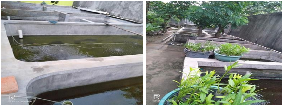
Gambar 2. Kolam Budidaya Ikan

Kegiatan budidaya yang dijalankan terutama dalam kondisi masa pandemi relatif berkurang dimana kolam-kolam dan bak-bak pemeliharaan tidak dimanfaatkan secara penuh hanya sekitar 60% bak digunakan untuk pemeliharaan induk, pemijahan, pemeliharaan larva, pendederan dan proses pembesaran. Secara umum jenis ikan yang dikembangkan sesuai dengan permintaan pasar meliputi ikan lele dan ikan nila baik penyediaan benih maupun ukuran konsumsi. Selain itu mengembangkan budidaya ikan hias seperti nila merah, koki, ikan cupang dan guppy.