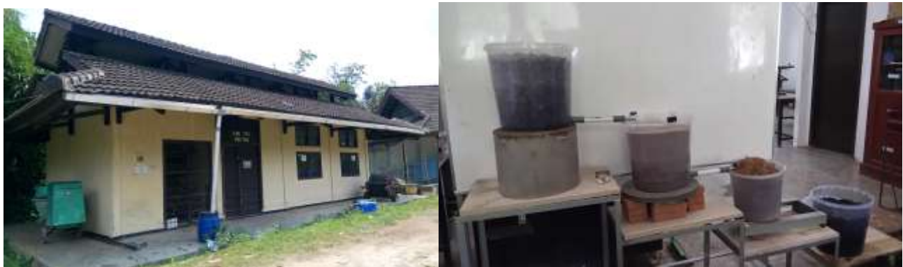
Gambar 2. Rangkaian Sistem RWH dan Material Filtrasi

Air hujan kemudian dialirkan ke dalam sebuah sistem penyaringan (filtrasi) yang disusun secara seri. Material yang digunakan dalam sistem filtrasi sesuai urutan adalah kerikil, pasir silika, serabut kelapa, dan arang aktif. Kerikil, pasir silika, dan serabut kelapa digunakan untuk menyaring partikel-partikel yang terlarut di dalam air hujan. Pemakaian serabut kelapa sebagai alternatif bahan pengganti filter ijuk yang sudah mulai sulit ditemui. Sedangkan arang aktif digunakan untuk menjernihkan warna air hujan. Air hujan hasil filtrasi kemudian diuji kualitas fisik, kimia, biologi dan parameter tambahan lainnya. Nilai kualitas air hujan hasil filtrasi dapat dimanfaatkan untuk keperluan sesuai dengan acuan Peraturan Menteri Kesehatan (Pemenkes) No. 416/MEN.KES/PER/IX/1990 tentang Syarat-Syarat dan Pengawasan Kualitas Air. Sistem RWH dan rangkaian material filtrasi yang digunakan terlihat pada Gambar 2.