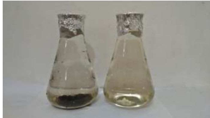
Gambar 3. Air Hujan Terkumpul (Kiri) dan Air Hujan Hasil Filtrasi (Kanan)

kimia pada air hujan sebelum filtrasi sudah memenuhi standar baku mutu air bersih. Nilai kualitas air hujan hasil filtrasi untuk parameter kekeruhan sebesar 2,02 NTU dan total padatan terlarut sebesar 20,48 mengalami penurunan yang cukup signifikan. Padatan terlarut yang ada di dalam air hujan sehingga memberikan nilai kekeruhan artinya sudah tersaring melalui material filtrasi. Nilai pH sebesar 7,96 juga meningkat secara signifikan sehingga memenuhi baku mutu air bersih. Perbandingan yang terlihat antara air hujan terkumpul dan air hujan hasil filtrasi disajikan dalam Gambar 3.