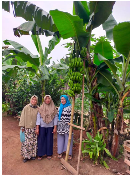
Gambar 5. Pertumbuhan tanaman pisang hasil demplot di pekarangan rumah