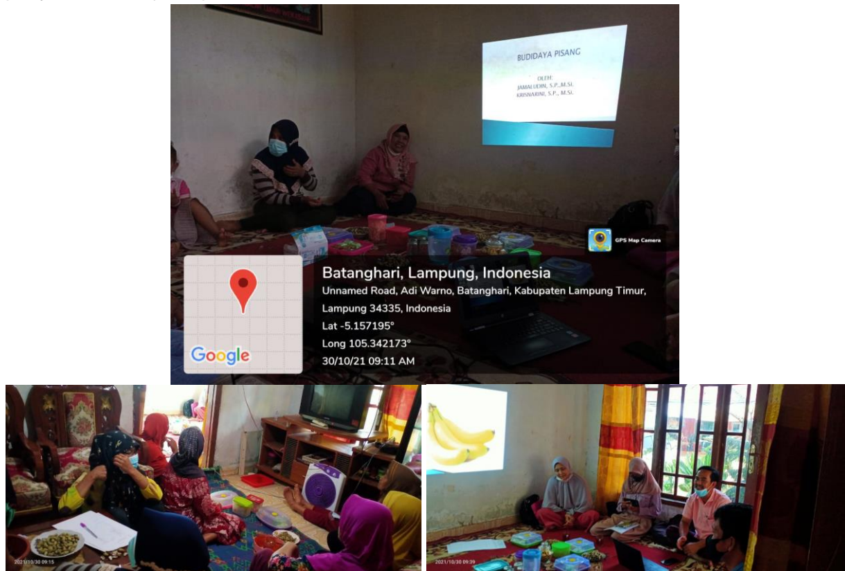
Gambar 1. Suasana peserta dalam mengikuti kegiatan penyuluhan

Kegiatan tersebut berlangsung cukup menarik karena seluruh anggota terlibat aktif dalam mendengarkan materi yang diberikan dan dalam kegiatan diskusi. Suasana kegiatan penyuluhan disajikan pada Gambar 1.