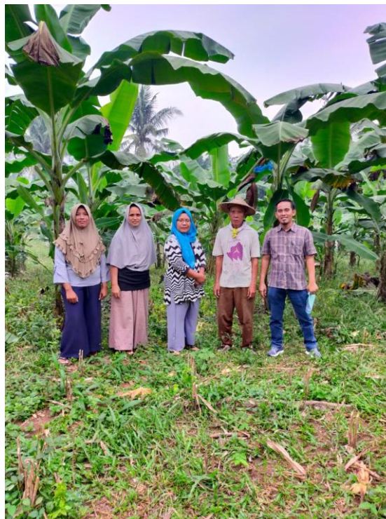
Gambar 6. Pertumbuhan tanaman pisang hasil demplot di kebun kolektif KWT

Kendala yang dihadapi anggota KWT Rukun tani dalam penanaman pisang di pekarangan rumah adalah adanya ayam yang mengganggu tanaman pisang saat baru ditanam atau saat tanaman pisang mulai tumbuh anakan dengan memakan daun tanaman pisang sehingga tanaman menjadi rusak. Meskipun telah ditutup dengan menggunakan waring, namun di beberapa anggota kelompok serangan ayam tersebut mengakibatkan tanaman pisang yang ditanam menjadi mati. Namun demikian anggota tersebut kembali