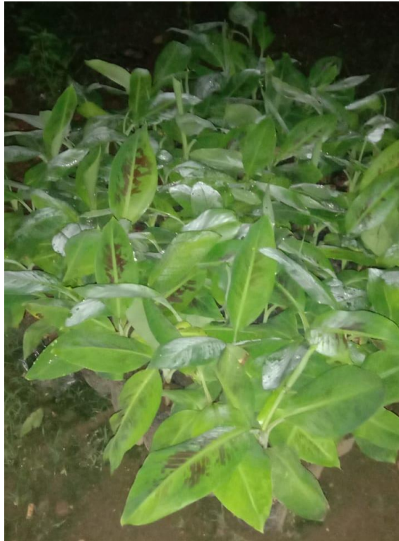
Gambar 2. Bibit pisang Cavendish hasil kultur jaringan yang diserahkan ke anggota KWT Rukun Tani

pisang lainnya. Karena keterbatasan lahan yang dimiliki maka jumlah bibit yang diterima masing-masing anggota kelompok tidak sama, yaitu berkisar antara 1 hingga 5 bibit pisang. Selain ditanam dipekarangan rumah, bibit pisang yang diberikan juga ditanam di kebun kolektif milik kelompok dengan pemeliharaan dilakukan secara bersama-sama oleh anggota kelompok. Suasana pemberian bibit pisang disajikan pada Gambar 3.