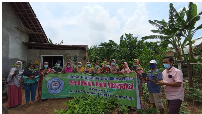
Gambar 3. Suasana penyerahan bibit pisang Cavendish

Setelah seluruh anggota menerima bibit pisang yang diberikan, kegiatan selanjutnya adalah dilakukan praktik penanaman pisang, dimulai dengan pembuatan lubang tanam dan pemberian pupuk kandang hingga penanaman bibit. Berdasarkan hasil praktik pembuatan lubang tanam diketahui bahwa hampir seluruh anggota belum mengetahui cara pembuatan lubang tanam yang baik dan benar, yaitu masih mencampur tanah hasil galian antara tanah lapisan atas dan tanah lapisan bawah. Cara pembuatan lubang tanam yang baik adalah dengan memisahkan antara tanah lapisan atas dan tanah lapisan bawah untuk selanjutnya