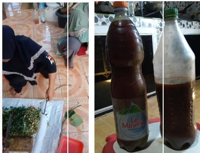
Gambar 6. Pembuatan dan Produk Pestisida Nabati Hasil Modifikasi KWT Handayani

Peningkatan keterampilan ditunjukkan dengan keberlanjutan perbanyakkan dan pembuatan kompos Azolla serta pembuatan pestisida nabati. Perbanyakkan Azolla terus dilakukan di kolam yang telah dibuat sebelumnya dengan penambahan pupuk kandang sapi. Apabila kompos Azolla belum jadi, maka anggota KWT memberikan Azolla segar pada pertanaman cabai mereka. Pembuatan pestisida nabati dimodifikasi dengan bahan yang memiliki kandungan yang sama dengan bahan utama (Gambar 6).