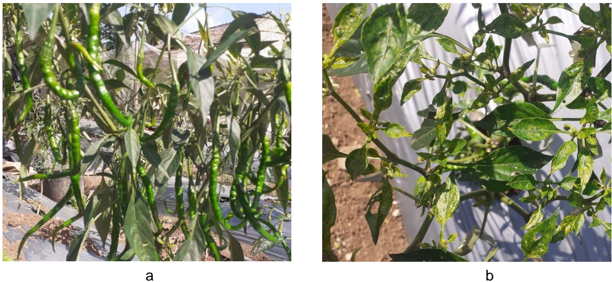
Gambar 4. a. Buah Cabai Produk Budidaya Cabai Organik, b. Gejala Penyakit yang muncul pada Lahan Demplot

Aplikasi pestisida nabati yang dilakukan secara rutin terlihat pada berkurangnya tanaman yang terserang penyakit kuning. Tanaman tumbuh lebih sehat, tumbuh tinggi dengan tunas-tunas air yang rutin diwil. Dampak akhir dari tanaman yang sehat dan tumbuh baik adalah dengan hasil panen yang diperoleh per tanaman lebih tinggi. Berdasarkan hasil pengamatan saat pengabdian masyarakat menunjukkan bahwa tanaman cabai yang diimplementasikan dengan teknologi tersebut intensitas gejala penyakit kuning hanya sampai 30% dari luas lahan demplot. Potensi produksi cabai bisa mencapai 5,4 kg/50 m 2 atau setara dengan 10,8 kg/100 m 2 .