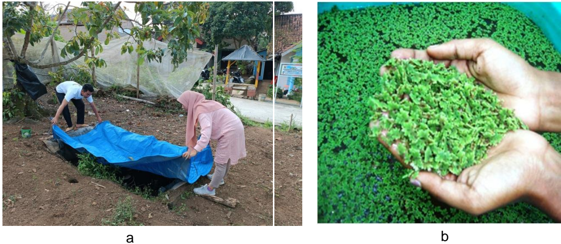
Gambar 2. a. Pembuatan Pupuk Kompos Azolla, b. Azolla pinnata

Pendampingan selanjutnya dengan pembuatan pestisida nabati yang berbahan dasar mimba, lengkuas, serih, klerek, EM4 dan molase yang diinkubasi selama 1-2 minggu. Penggunaan bahan ini dipilih supaya KWT Handayani mampu melakukan produksi pestisida nabati secara mandiri dan bisa diaplikasikan setelah proses inkubasi berlangsung, sehingga KWT mampu mengatur penggunaan dan pembuatan pestisida nabati (Gambar 4). Aplikasi pestisida nabati dilakukan lebih sering daripada pestisida kimia. Meskipun demikian, tidak memberikan dampak berbahaya bagi lingkungan karena terbuat dari bahan organik yang mudah terurai sehingga dampak racun dan resistensi OPT cenderung bahkan tidak ada. Kelebihan selanjutnya dari penggunaan pestisida nabati yaitu hasil panen lebih aman dikonsumsi dan dapat memberikan nilai tambah dari produk yang dihasilkan karena produk organik bisa dijual dengan harga yang lebih tinggi.