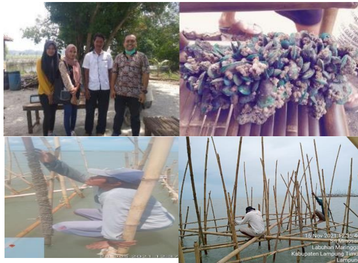
Gambar 2. Budidaya kerang hijau di lokasi pengabdian

Pemanfaatan bagan tancap jaring apung yang kami introduksikan ini selain untuk usaha masyarakat kami juga jadikan sebagai pusat pengetahuan dan pendidikan bagi mahasiswa Politeknik Negeri Lampung khususnya mahasiswa program studi Budidaya Perikanan. Hal ini menjadi penting guna meningkatkan keahlian teknis bagi mereka khususnya dalam budidaya kekerangan yang masih jarang di Indonesia.