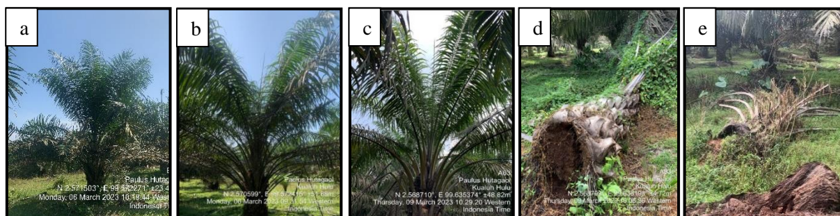
Gambar 2. Gejala serangan penyakit busuk pangkal batang pada kelapa sawit: a. Tanaman dengan daun muda lebih kerdil dari tanaman sehat, b. Tanaman dengan daun tombak tidak mekar, c. Tanaman dengan pelepah tua kering dan patah, d. Tanaman tumbang, dan e. Tanaman mati

Hasil penelitian mengungkapkan bahwa penyakit BPB berkembang merata pada kelapa sawit hasil peremajaan satu (generasi dua) umur 5 tahun baik pada blok kebun yang residu batang sawitnya ditumbang saja maupun tumbang-cacah-serak di permukaan tanah. Busuk pangkal batang yang menjadi penyakit utama kelapa sawit di Indonesia dapat menimbulkan kerugian pada tanaman belum menghasilkan maupun tanaman menghasilkan. Serangan G. boninense dipengaruhi oleh banyak faktor, antara lain adalah sejarah vegetasi sebelum dikonversi menjadi perkebunan kelapa sawit. BPB lebih cepat muncul pada kebun yang sebelumnya mempunyai vegetasi hutan, karet atau kelapa (Merciere et al., 2017). Biomassa pohon hutan dan karet yang tersisa di lahan menjadi sumber inokulum yang sangat potensial bagi G. boninense sebelum menyerang kelapa sawit.